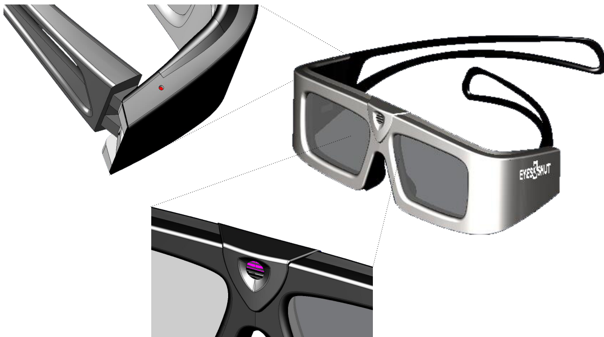
Окуляри ODYSSEY. Крупним планом датчик, та світловий індикатор недостатнього заряджання

Світловий індикатор недостатнього заряджання знаходиться з правої сторони оправы. Цей індикатор вмикається коли залишкове заряджання акумулятору складає 10% від номінальної (автономія роботи не більше 4 годин).