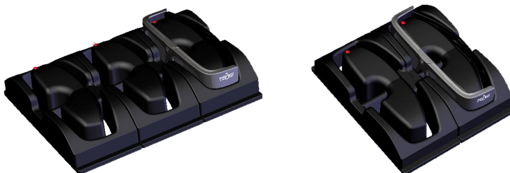
Окуляри ODYSSEY в в подвійному та потрійному зарядному пристрої

Для заряджання акумулятору досить розмістити окуляри в зарядному пристрої. Під час заряджання окулярів вмикається червоний індикатор. Якщо окуляри заряджені, то індикатор гасне.