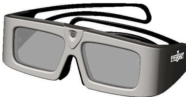
Активні окуляри ODYSSEY

Тривалість служби акумулятору складає приблизно 500 заряджання, що еквівалентно 20 000 годин використання.